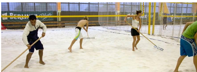
Nivelage du sable par ratissage après chaque séance

L'entretien de l'aire de jeu sablée est une opération qui vise à décompacter le sable et à réduire les risques de contamination des joueurs. Il est conseillé un nettoyage périodique par ratissage du sable pour l'aérer et éliminer les éventuels corps étrangers. L'utilisation d'un motoculteur plusieurs fois par an évite un tassement des couches supérieures du sable. Enfin, pour garantir tout risque de contaminations microbiologiques un nettoyage annuel mécanique et biologique en profondeur (40cm) de type Sandmaster permet simultanément l'aération du sol et l'extraction des impuretés. Il convient de protéger le sable des animaux en utilisant une clôture adaptée tout autour de l'aire de jeu.