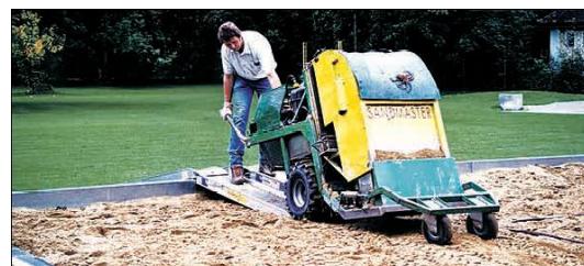
Nettoyage du sable en profondeur une fois par an